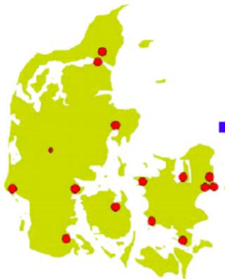
Centralized System of the mid 1980's